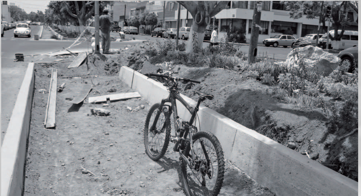
• Fotos: Óscar Domínguez Construcción de la Ciclovía del Centenario. 13 de mayo de 2009 y www.robortorey.es "Disfrutando del anochecer desde las bicicletas - Kdd Miño", en www.flickr.com

En la ciudad de Bogotá, Colombia, se transporta en bicicleta uno de cada cuatro habitantes. En Puebla es construida en estos días la primera ciclovía formal, de kilómetro y medio de longitud