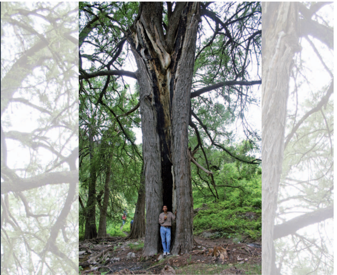
• Fotos: ◀ Yenuán Lesus, en www.flickr.com ▲ Aurelio Fernández Paraje en el sur del municipio poblano

Huejotzingo. Y también en ese caso emergieron los movimientos de defensa de la tierra y el agua en San Andrés Azumiatla, San Bernardino Tlaxcalancingo, Santa María Acuexcomac, Buena Vista, San Lucas Atzala y Santa María Zacatepec.