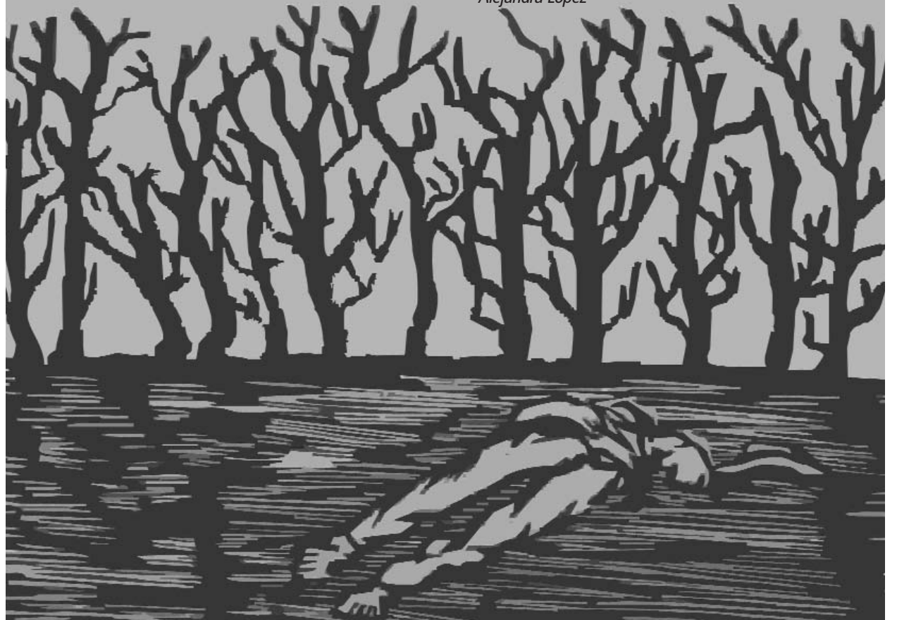
• Imagen de portada: Ferreira , "Campesino asesinado", xilografía. En Musacchio, Humberto, El Taller de Gráfica Popular . FCE, 2007.