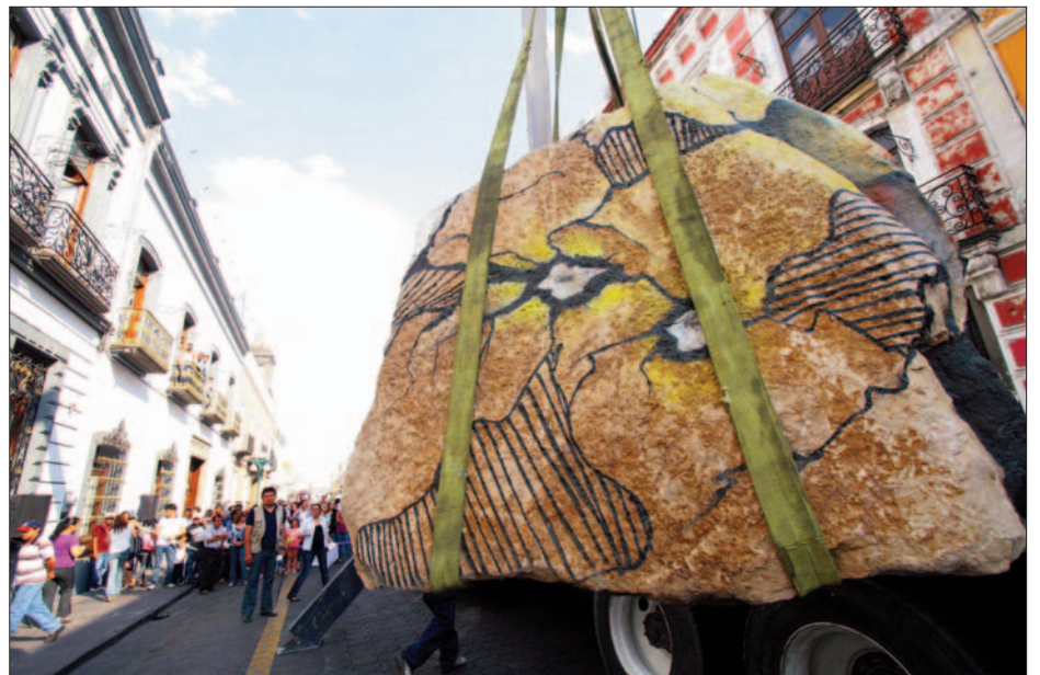
Integrantes de la organización Actívate por Puebla colocaron una piedra de seis toneladas de peso frente al Congreso local para demandar dicha reforma ■ Foto Rafael García Otero ■ 6

El zócalo de Puebla, bloqueado para que Televisa pueda grabar al “chef Oropeza”