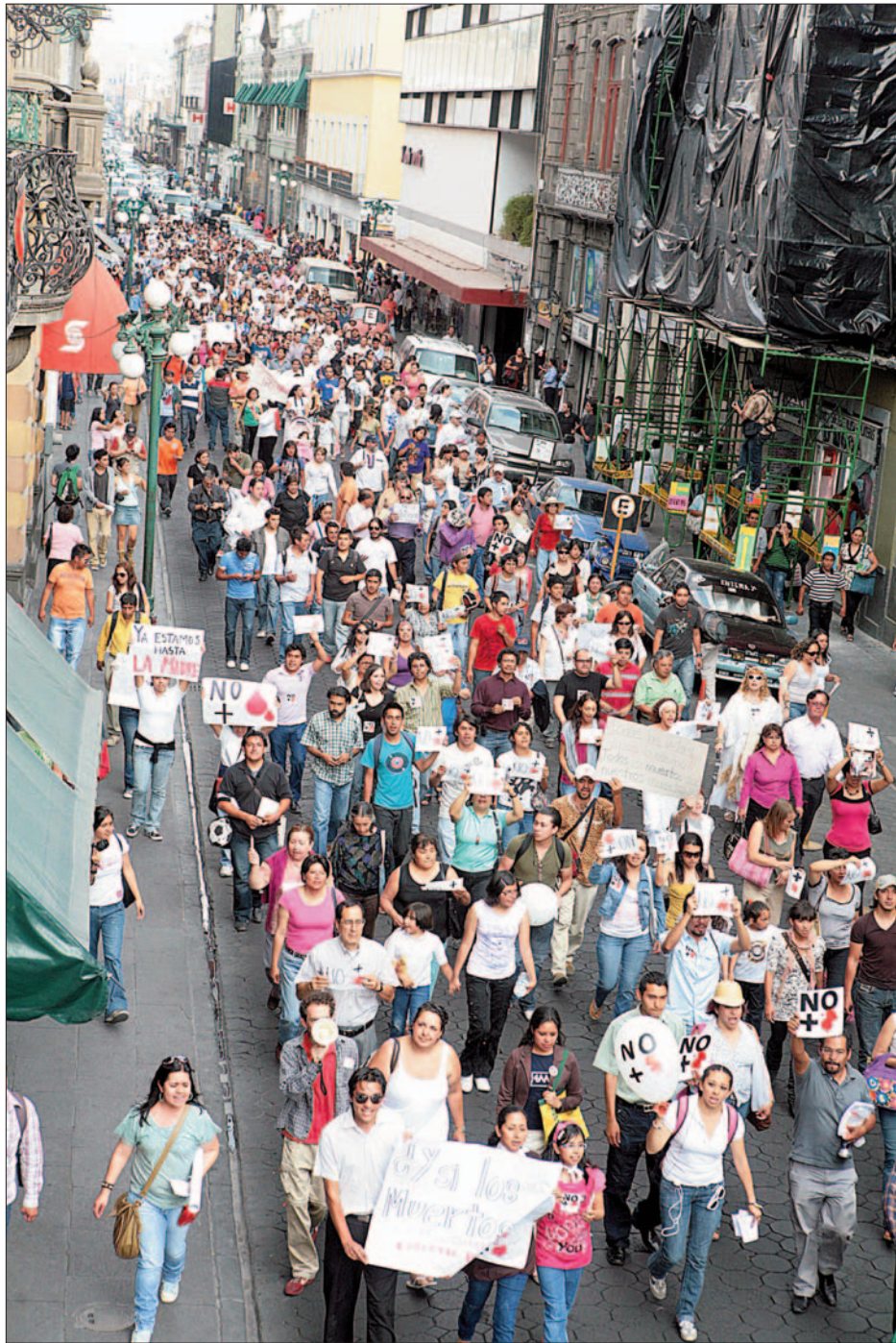
A la par de muchas otras partes del país y del mundo, la marcha contra la violencia se efectuó ayer en Puebla ■ Foto José Castañares ■ 3

■ La empresa vendió su cartera a Tertius