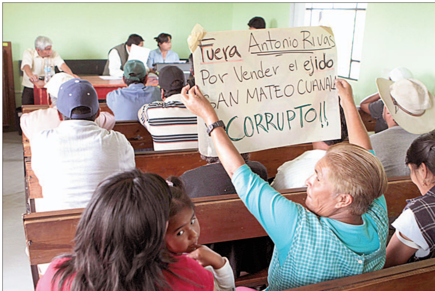
Ejidatarios de este municipio durante una reunión efectuada ayer en el mismo

Cada mes hay 194 quejas por violar derechos humanos: CDH