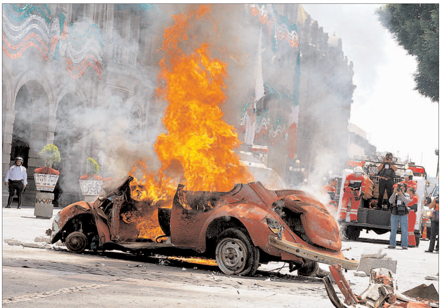
El viernes pasado se llevó a cabo el rescate de supuestas víctimas durante dicha práctica