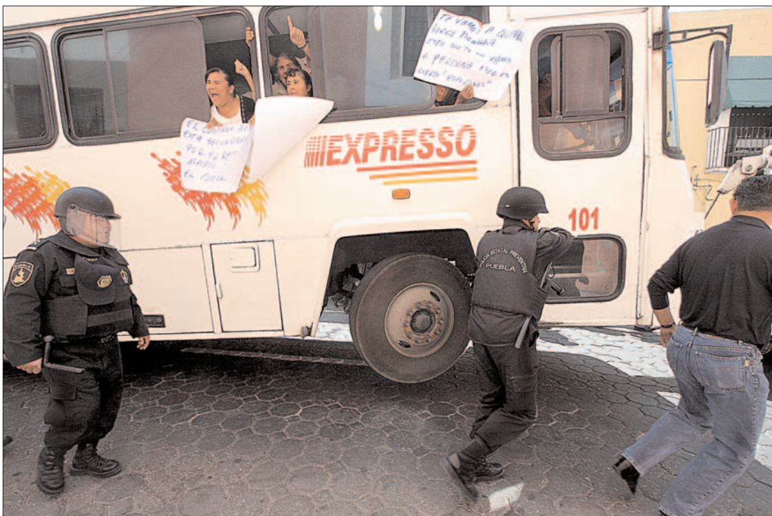
Tres elementos de la Secretaría de Seguridad Pública de Puebla golpearon, insultaron y amenazaron a un habitante de aquel municipio luego de que intentó impedir que incautaran el autobús en el que 50 personas se transportaban al Congreso. En la gráfica, el vehículo es remolcado por una grúa ■ Foto Rafael García Otero ■ 5

Supera Alcalá a Marín, a Paredes y a Doger en la calificación ciudadana a su primer año de gestión