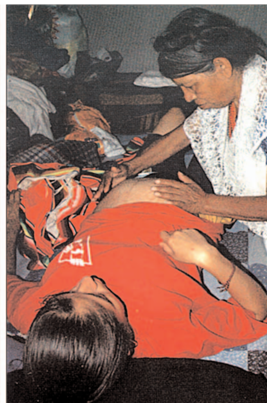
El libro de la investigadora y una de las fotografías mostradas en el mismo

plo la placenta no se deshace nada más así, la placenta a veces se entierra debajo del fogón, a veces se sube a un árbol, hay todo un significado importante porque la placenta tiene una relación simbólica con el niño que acaba de nacer. La partera limpia a la mujer después del parto, la acuesta y le prepara un caldo, muchas veces en los hospitales no dan nada de comer; si se acostumbra el temascal se hacen los baños de temascal. Entonces son 15 días por lo menos después del parto en que la partera atiende a la mujer en todas sus necesidades. Cuando una partera se compromete atender a una mujer pase lo que pase ella va a su casa cuando hay frío o lluvia; la partera va a estar allí cuando la llamen y un médico sabemos que no está, lo ideal es que los niños no nacieran en fin de semana porque ya no están los médicos en las clínicas”.