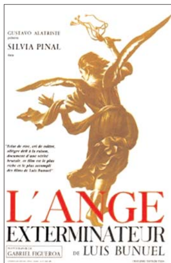
Sobre estas líneas, uno de los carteles del filme y dos fotogramas del mismo

Hoy, miércoles 15 de octubre, el cineclub de la Facultad de Filosofía y Letras de la UAP (3 Oriente 210, Centro) presentará El ángel exterminador , a las 13 horas, dentro de su ciclo Cine y surrealismo II , en el salón de usos múltiples.