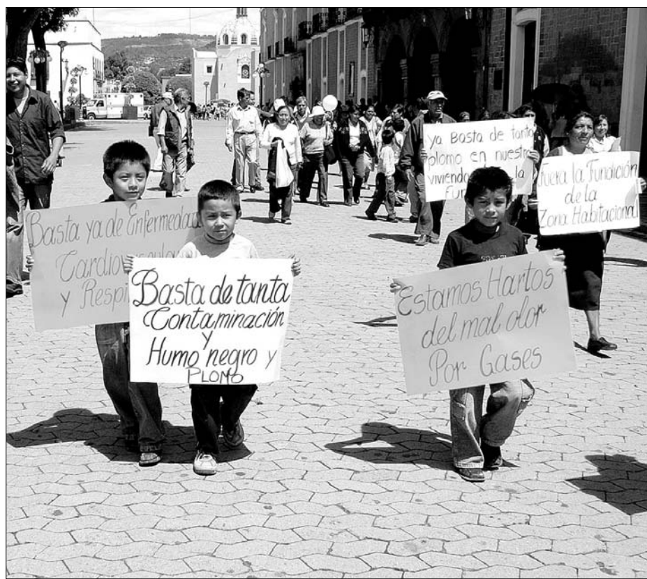
Habitantes de San Pablo del Monte denunciaron que las emisiones de una empresa probablemente provocaron la muerte por cáncer de tres menores ■ Foto: Alejandro Ancona

Inmovilizó Profeco cinco estaciones de servicio en primer semestre de 2008 ■ 2