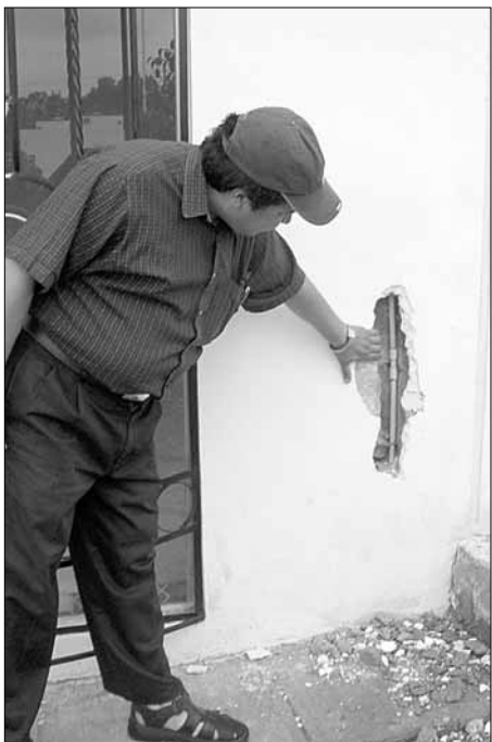
Las profundas fisuras en los muros de las viviendas son sólo una de múltiples anomalías

▲ Con esta decisión, automáticamente dejar de ser alcalde: Lozano