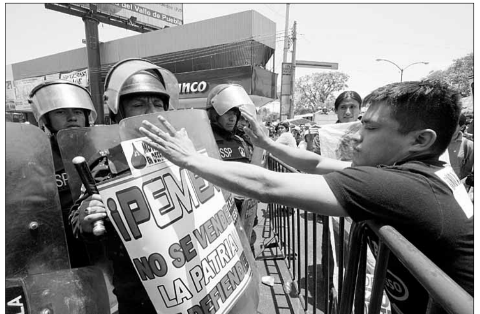
A la izquierda, el secretario de Defensa, Guillermo Galván; el presidente de la República, Felipe Calderón Hinojosa, y el gobernador de Puebla, Mario Marín Torres, presencian el desfile conmemorativo; a la derecha, un grupo de policías estatales impide avanzar a los integrantes de las Redes Ciudadanas que se manifestaron ayer contra la iniciativa de reforma energética del gobierno federal ■ 3

El precio actual del microbús es de 5 pesos; comparado con la calidad del servicio, ¿diría que es caro o barato?