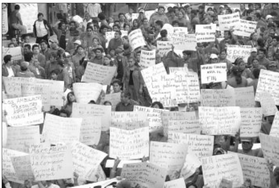
Las llamadas "fuerzas vivas" del priismo local expresaron así su respaldo al Ejecutivo local. Los cálculos más conservadores aseguraban que hubo sólo 10 mil participantes; los más exagerados, es decir, los del Revolucionario Institucional, afirmaron que no hubo menos de 50 mil personas apoyando al mandatario

El tricolor perdió 4 puntos en 4 días: encuesta